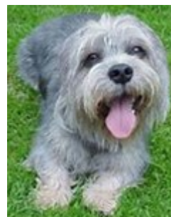
Dandie Dinmont Terrier