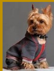
(Segundo o estalão nº 86f da FCI de 28 de setembro de 1988)

Finalmente, é essencial proporcionar passeios regulares ao Yorkshire para permitir que liberte energias e fique mais tranquilo em casa. Dado que o Yorkie não tolera bem baixas temperaturas, é importante agasalhá-lo durante os passeios nos invernos mais rigorosos.