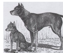
Ilustração de Jean Bungartz que compara o Pinscher Miniatura com o Pinscher Alemão (1888)

Terremoto de 4 patas: Apesar do seu tamanho reduzido, a força e a energia do Pinscher Miniatura são surpreendentes. Quando estão animados, a correr de um lado para o outro com alegria contagiante, parecem criar um tremor em toda a casa.