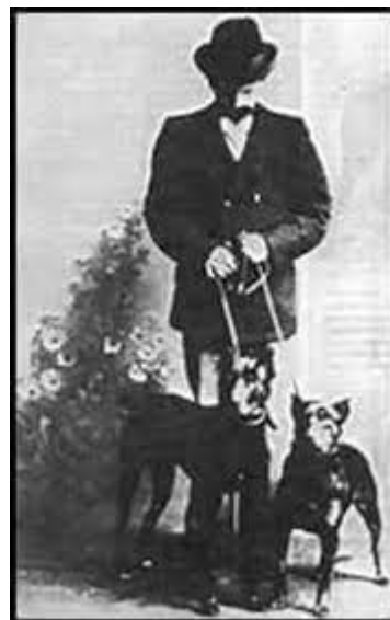
Friedrich Ludwig Dobermann

Assim, devido à sua característica pelagem preta afogueada, alguns cinófilos franceses pensaram no beauceron gaulês.