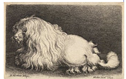
Gravura de caniche do Século XVII