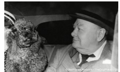
Churchill também era fã de Caniches