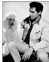
Elvis Presley com um dos seus caniches

Durante a Segunda Guerra Mundial, os poodles estavam entre as 32 raças que foram oficialmente classificadas como cães de guerra pelo Exército dos EUA.