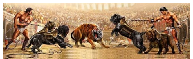
Ilustração retratando como teriam sido os Canis Pugnax nos jogos de gladiadores

em todo o mundo. Nos dias de hoje, os cães militares continuam a desempenhar um papel crucial nas forças armadas, polícias e unidades especiais, destacando-se em operações de resgate, perseguição e detecção de drogas e explosivos. A prática de utilizar cães no exército remonta à época da República Romana (509-27 a.C.), evidenciando uma tradição de longa data com eficácia comprovada ao longo dos séculos.