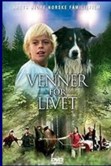
Encontrando Amigos. 2005