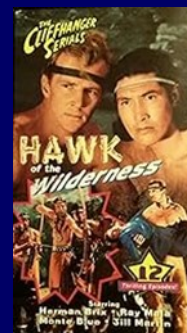
Falcão do Deserto. 1938

Os Pastores Australianos também são conhecidos como AUSSIES, gíria que os australianos usam para designar os seus compatriotas.