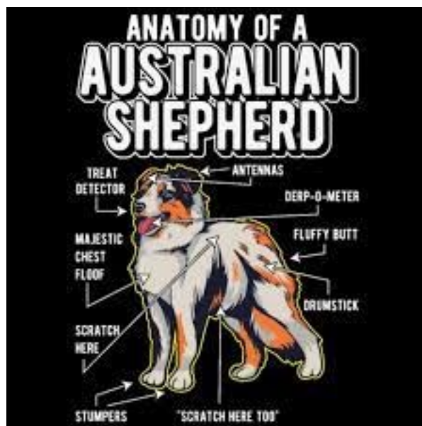
Blue Merle Bobtail Cross

O Pastor Australiano pertence ao grupo UK Rural, assim como o Collie, o Shetland Sheepdog e o Border Collie. Como muitos cães deste grupo, o Pastor Australiano carrega a mutação MDR1, que causa sensibilidade à IVERMECTINA (Trata-se de um medicamento que faz parte do grupo dos antiparasitários).