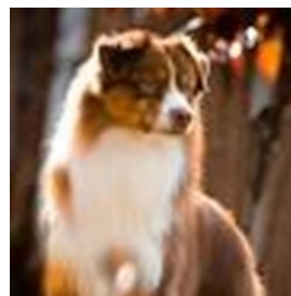
Merle vermelho tricolor