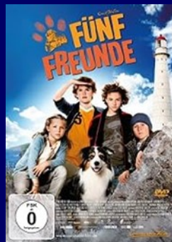
Os Famosos Cinco 2012