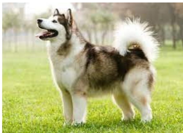
Malamute do Alasca