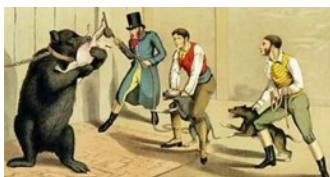
Bear-Baiting Publicado por Thomas Alken em 1820