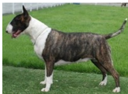
Tigrado e branco