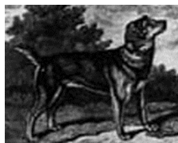
Black and Tan Terrier