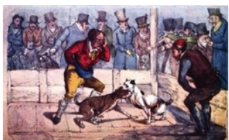
Dog-baiting, final do século XIX

Dog-baiting, uma prática cruel e desumana, persiste em algumas regiões do mundo, apesar de ser ilegal na maioria dos países. Essa atividade não tem justificção e é amplamente condenada pela brutalidade.