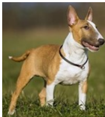
Branco e fulvo