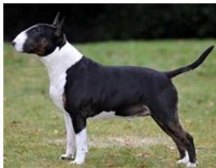
Branco e preto