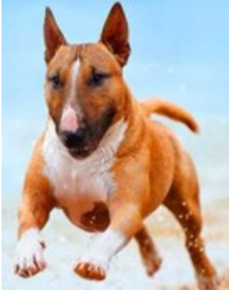
Branco e vermelho