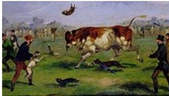
Bull-baiting no século XIX, pintado por Samuel Henry Alken