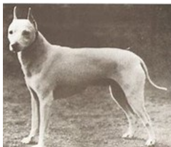
Old English White Terrier